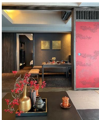
プレミアムルーム写真 (夏水組監修)

当施設は、客室・エントランスを株式会社夏水組がデザイン監修し、イタリア老舗メーカーBERTOZZI（ベルトツィ）社による手彫り木版のハンドプリントや伊勢型紙と呼ばれる型紙を用いた内装材で装飾を施すなど、高級感と落ち着きのある客室をご用意し、伝統工芸を気軽に体験いただけるサービスもご提供します。また、大阪メトロ「四ツ橋」駅徒歩 2 分、「心斎橋」駅徒歩 6 分の駅から近い立地ながら、落ち着いてすごしやすい周辺環境でワーケーションなどの中長期滞在にも適しています。