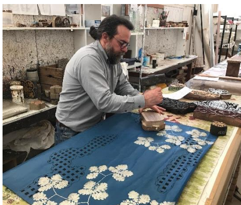
プレミアムルーム内装材制作風景 (イタリアの木版で越前和紙に印刷)