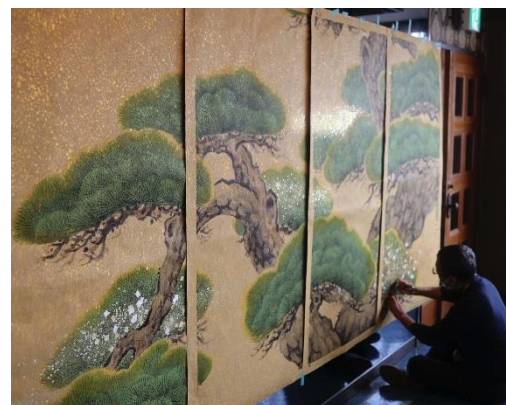
エントランス襖絵パネル制作風景 (金砂子技法を使用した襖絵装飾)

「APARTMENT HOTEL MIMARU」( https://mimaruhotels.com/ )は、全客室キッチン付き、ダイニングスペースも備わった広い客室で、ゆったりと落ち着いてご自宅のようにお過ごしいただけます。