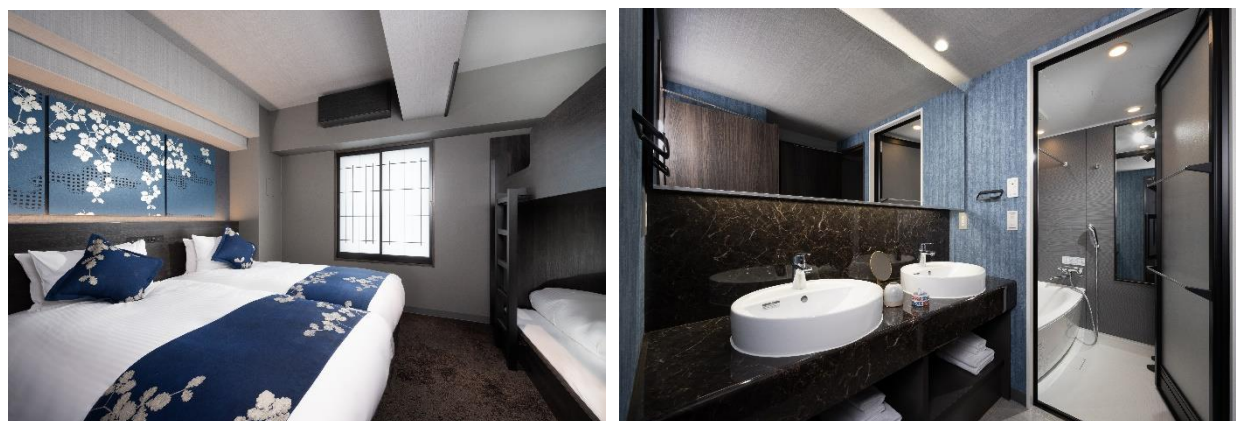
プレミアムルーム（ベッドルーム・洗面・浴室）