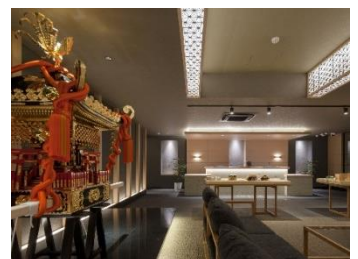
「MIMARU 東京 上野 NORTH」

縁日を模したロビーのある「MIMARU 大阪 難波 NORTH」や、のれん・提灯・屋台・酒樽などをイメージした「IZAKAYA」空間が広がるロビーでウェルカムサービスの日本酒や駄菓子を楽しめる「MIMARU 大阪 心斎橋 EAST」など、ホテル内でも楽しい演出をご用意しています。「MIMARU 東京 上野 NORTH」にはお神輿の展示や兜などのご紹介もしています。今後も夏祭りや日本の文化をご紹介しながら、地域と外国人を結ぶコミュニケーションを図ってまいります。