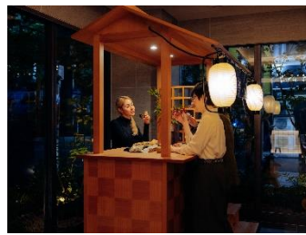
「MIMARU 大阪 心斎橋 EAST」