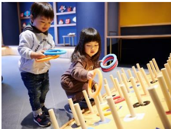
「MIMARU 大阪 難波 NORTH」

アンケートでは、ねぶた祭りや阿波踊り、雪まつりなどを推す声のほか、外国人ゲストからは有名なお祭りだけでなく、地域の縁日や盆踊りが喜ばれるという回答が多くありました。ただ見るだけではなく、縁日に並ぶ屋台の食べ物やゲームを楽しんだり、踊りに参加できたりするイベントは人気が高いそう。また、ゲームの景品などでもらう駄菓子は、驚くほど外国人ゲストに喜ばれます。パッケージの面白さや可愛さも含めて、日本だけのユニークな文化として受け入れられているようです。