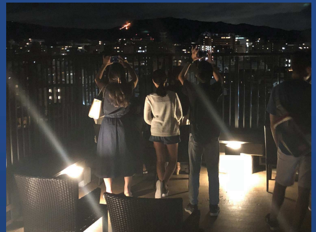
※Last year's event (at HORIKAWA ROKKAKU) 昨年のイベント時の写真(堀川六角)