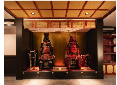
甲冑ディスプレイ