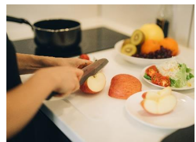
調理器具の揃ったキッチン