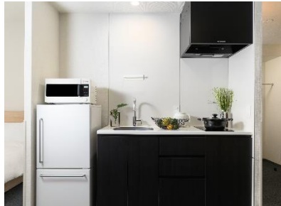
電子レンジ・食器・調理器具のあるキッチン