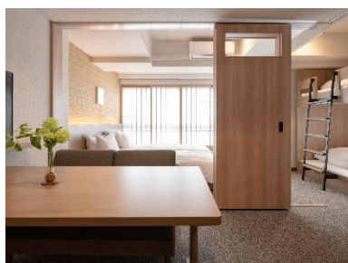
広いリビング・ダイニング