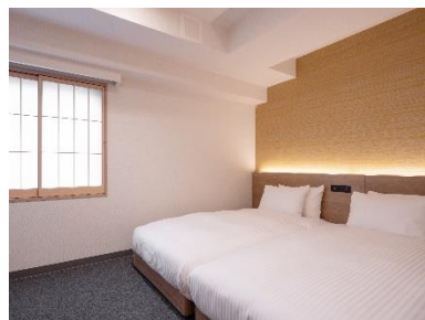
独立したベッドルーム