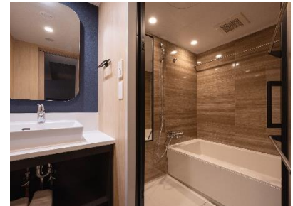
洗い場と湯船のあるバスルーム