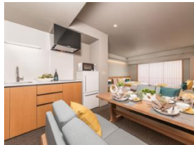
キッチン&ダイニング