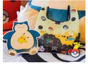
ポケモンルームオリジナルノベルティ（関西デザイン）

キッチンには食器や調理器具が揃っているので、京都の食材を使って料理をしたり、人気店のお惣菜をテイクアウトしたりするなど、外食が続きがちになるホテル滞在でも、思いのままに食事を楽しめます。また、旅の疲れを癒すバスタブつきのバスルームやランドリールームも完備しています。