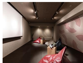
エンターテイメントルーム