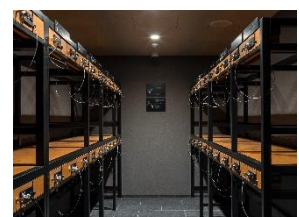
バゲッジストレージ

京都を拠点にして近隣の観光都市に出かけたい時、大きな荷物が邪魔になることも。『MIMARU 京都 河原町五条』では宿泊前後や中抜け宿泊時の荷物預かりサービスをご用意し、周遊旅を応援します。