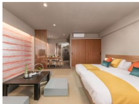
ジャパニーズルーム