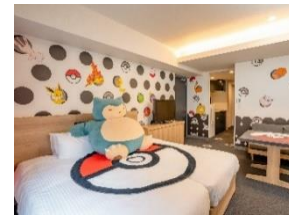
ポケモンルーム（イメージ）