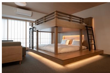
キングバンクベッド